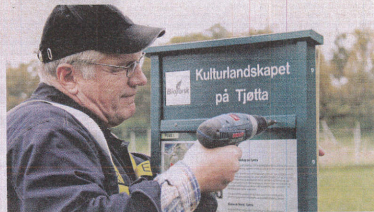
Oppretting av kultursti på Tjøtta. (Foto: Maja S. Kvalsund).