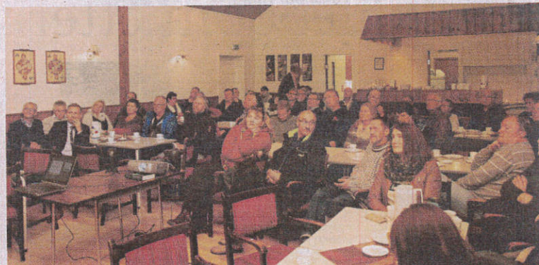
Seminaret trakk mange interesserte deltagere.