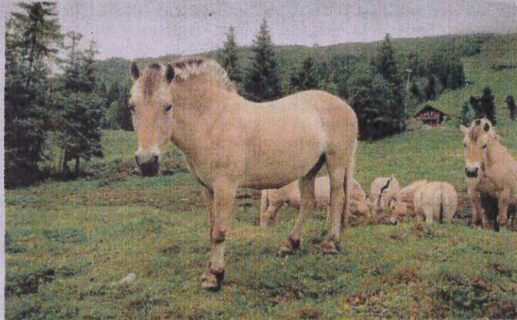
Den norske nasjonalhesten fjordingen står på lista til Norsk genressurscenter over utryddingstrua husdyrrasar. Hesteturisme kan bli ein måte å redde fjordingen på.

– Fjordingen er unik for Noreg. Me har eit ansvar her. Eigentleg burde det vera eit