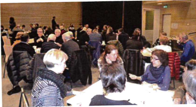
MYE FOLK og stort engasjement da Hamarøyfolket diskuterte kommuneplan.

Og professoren i nyskaping og bygdeutvikling hadde svært liten grunn til å bekymre seg for interesse og engasjement i Hamarøy da han sist lørdag deltok på folkemøte i Hamsunsenteret i forbindelse med kommunens arbeid med kommuneplanens samfunnsdel, der man skulle være spesielt opptatt av bolyst og næringsutvikling. Hele 90 personer hadde tatt turen til Presteid på en lørdag ettermiddag. Og de fikk lov til å uttrykke engasjementet sitt.